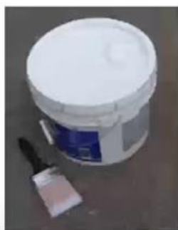
油漆物料(第3或第8類)